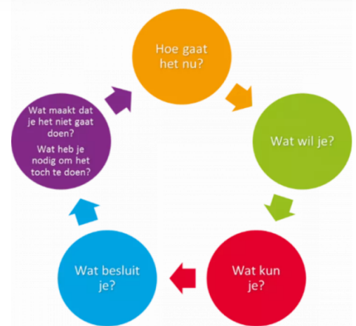
Figuur 2: Actiewiel